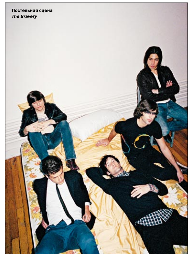
Постельная сцена The Bravery