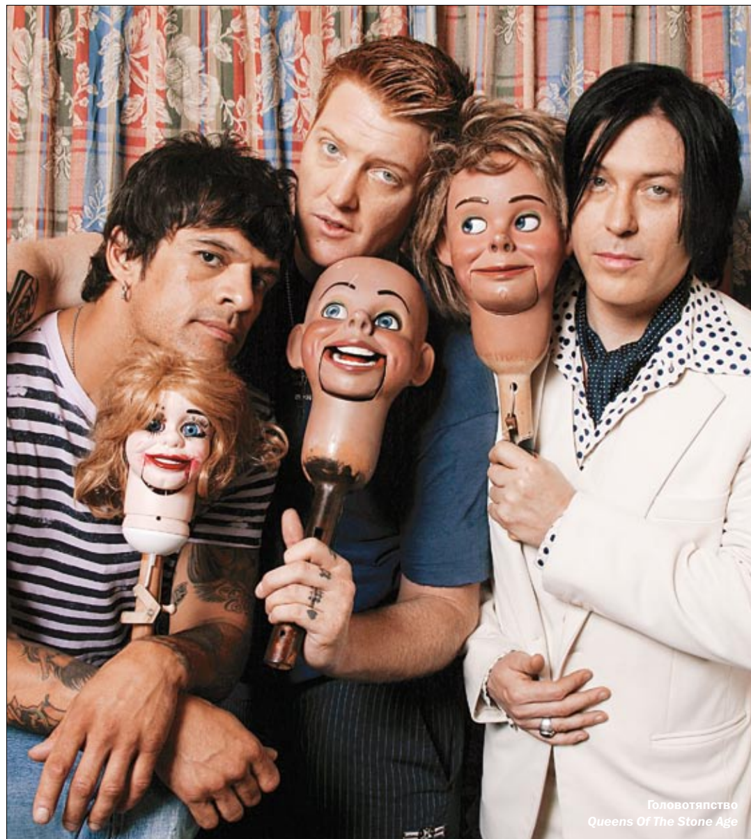
Головотяпство Queens Of The Stone Age